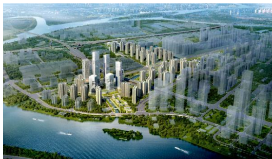
廣州荔灣區東塲村城市更新項目效果圖