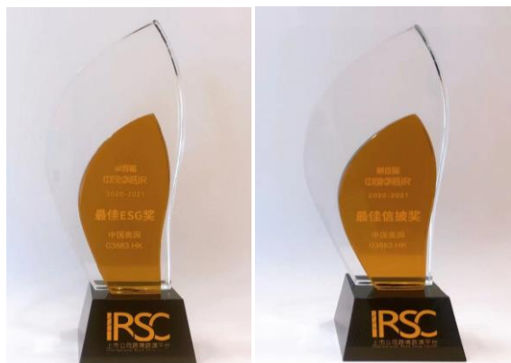
奧園——最佳ESG獎、最佳信披獎

「中國卓越IR評選」自2017年起每年舉辦，由RoadshowChina路演中、卓越IR主辦，致力於以專業、客觀、公正、準確的原則，評選出過往一年表現優秀的上市公司及投資者關係工作者，表彰他們為推動行業創新與高效所作的貢獻。