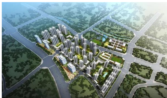
廣州黃埔區旺村城市更新項目效果圖

作為粵港澳大灣區城市更新的先行者，奧園已實現舊城、舊村、舊廠「三舊」改造全覆蓋。截至2020年6月底，擁有逾50個不同階段的城市更新項目，預計額外貢獻可售資源約人民幣6,587億元，其中粵港澳大灣區佔95%。未來，奧園將繼續發揮先發優勢，拓寬城市更新賽道，引領高質量可持續發展。